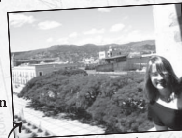
La autora frente a una vista de la ciudad de Oaxaca.

aquí, conoció Oaxaca cuando estudiaba en México. A él le interesaba el conflicto en Oaxaca de 2006, y por eso dice “quise regresar y aprender más sobre el ambiente de Oaxaca y las circunstancias de la resistencia”. Cómo Reister, otro grupo de inmigrantes se mudan a Oaxaca porque les atrae la política y quieren trabajar con grupos de justicia social en Oaxaca.